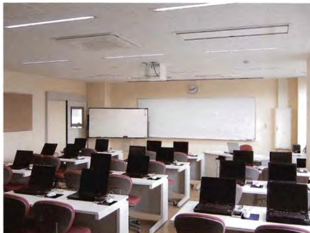
パソコンルーム1 (OA講習)