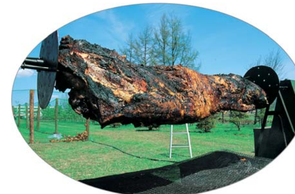
豪快な牛の丸焼き