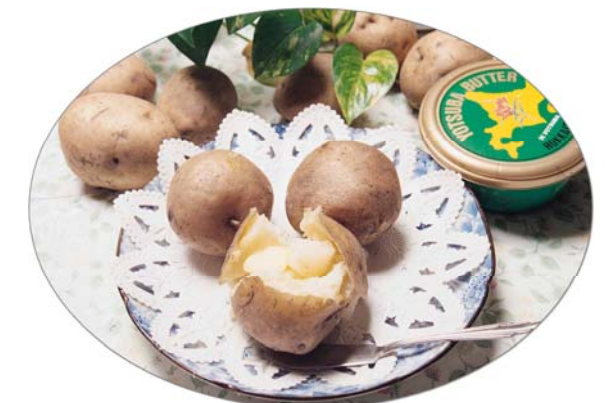
ホクホクじゃがいも